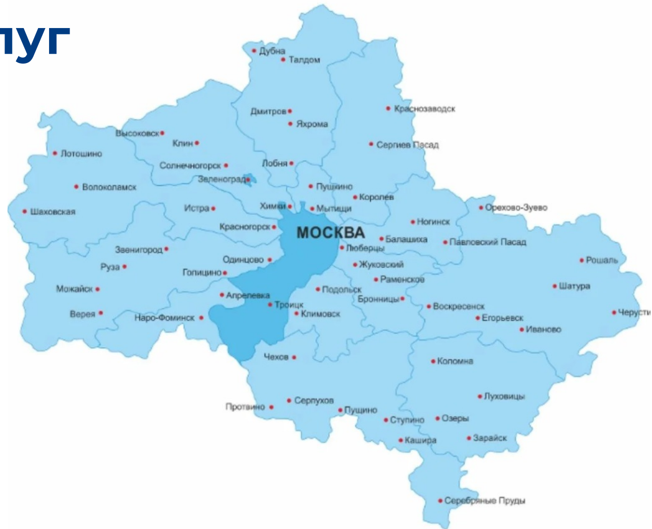
Москва и Московская область